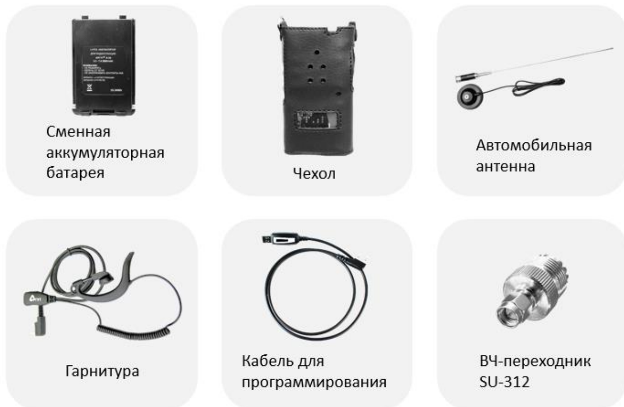
Рис. 13. Рекомендуемые аксессуары.

Рекомендуемые аксессуары Аргут к радиостанции представлены на рисунке 13.