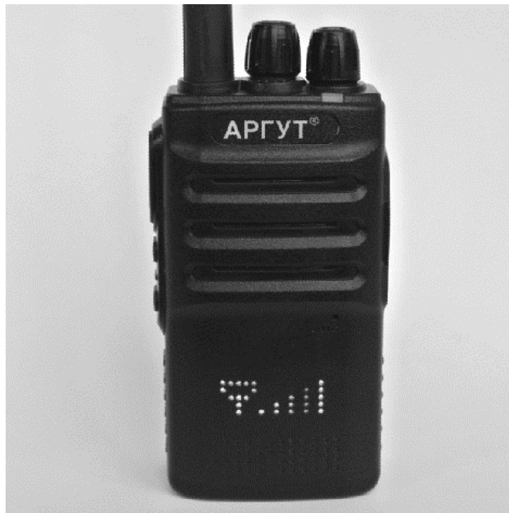
Рис. 12. Индикация уровня сигнала.