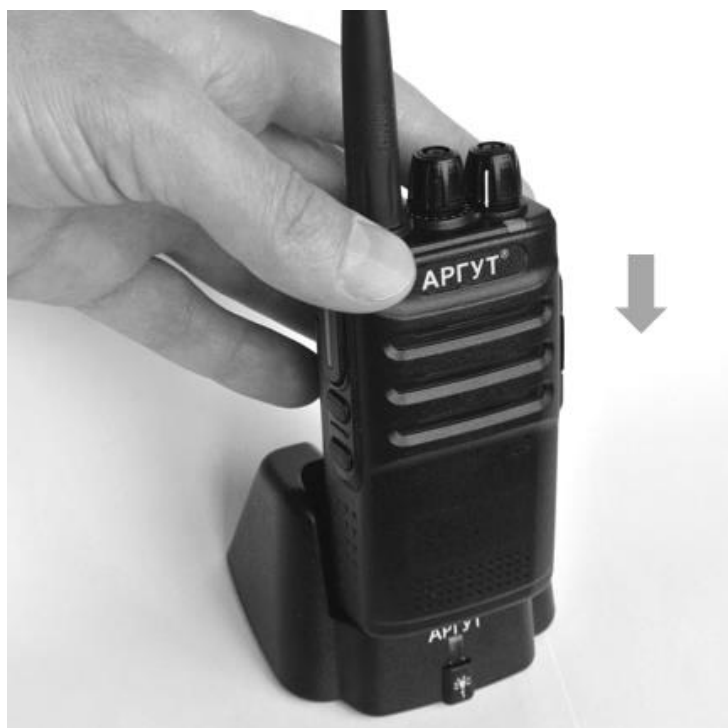
Рис. 6. Установка радиостанции на зарядную базу.

Установите радиостанцию с присоединённым аккумулятором на зарядную базу. Светодиодный индикатор на зарядной базе загорится красным. По окончании зарядки индикатор сменит цвет на зелёный — снимите радиостанцию с зарядной базы.