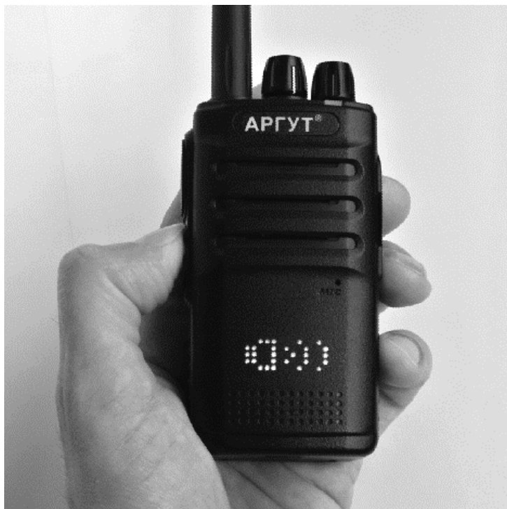
Рис. 11. Включение мониторинга.

Режим мониторинга отключает шумоподавление, позволяя прослушивать сигналы с низким уровнем, например, при радиосвязи на большом расстоянии. Для включения режима мониторинга нажмите и удерживайте кнопку 1. На дисплее отобразится значок мониторинга (рисунок 11).