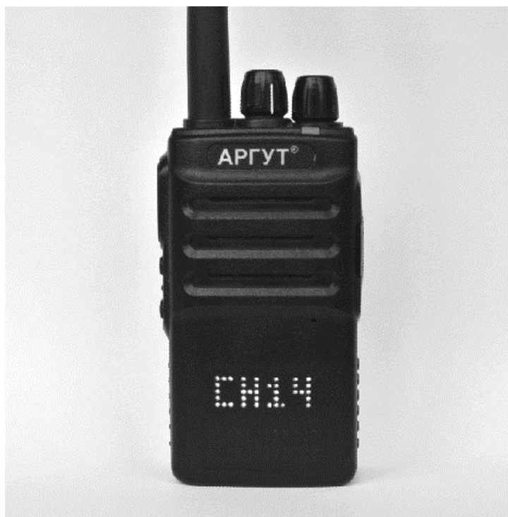
Рис. 9. Индикация номера канала.

Переключателем каналов выберите нужный канал. Номер канала индицируется на дисплее. При переключении из громкоговорителя звучит голосовая подсказка номера канала.