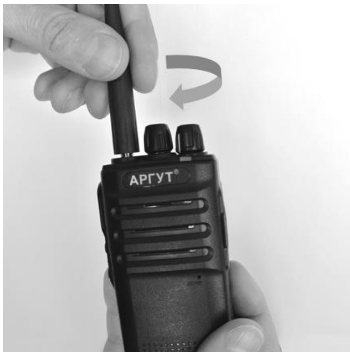
Рис. 4. Присоединение антенны.

Совместите резьбовой соединитель антенны с ВЧ-соединителем на верхней панели радиостанции. Вращая антенну по часовой стрелке закрутите соединитель до упора. Не прилагайте чрезмерных усилий при затяжке.