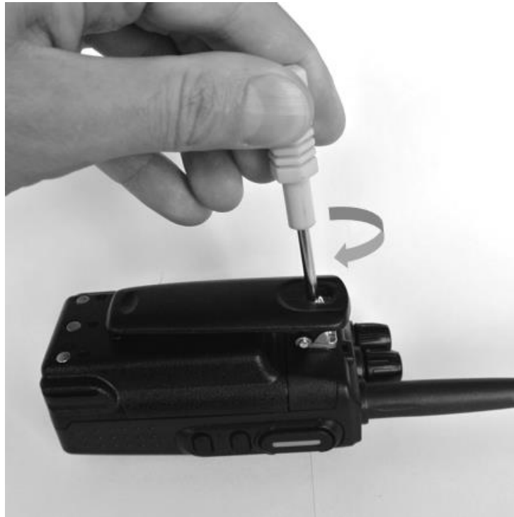
Рис. 5. Присоединение клипсы для крепления.

Если вы планируете носить радиостанцию на пояском ремне или крепить к одежде, присоедините к задней панели клипсу. Совместите крепёжное отверстие клипсы с отверстием на задней панели и закрепите клипсу с помощью винта из комплекта. Используйте крестовую отвёртку №3.