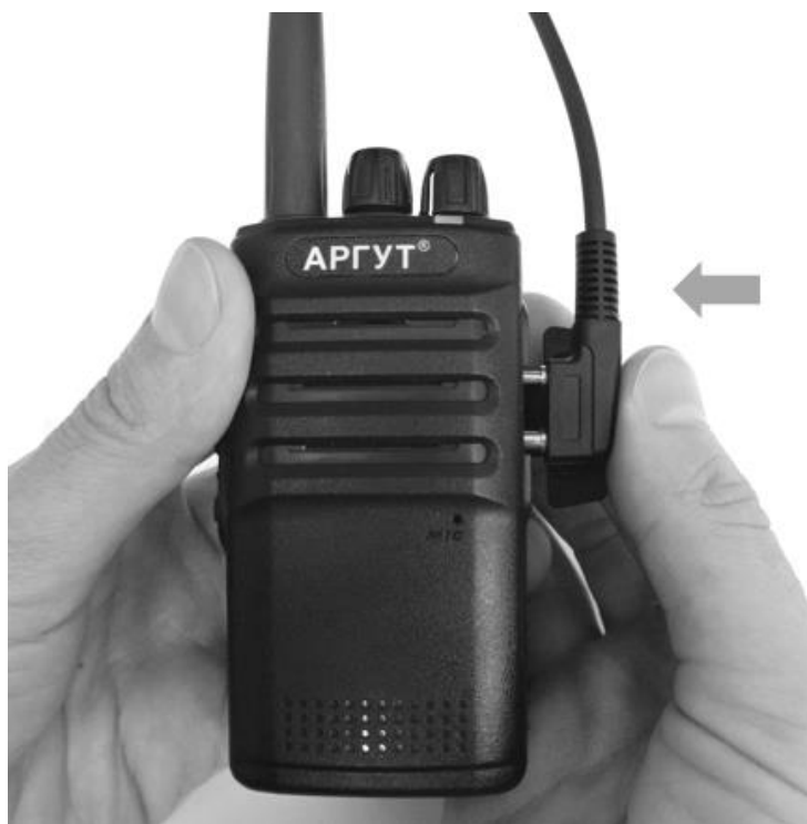
Рис. 8. Подключение гарнитуры.

Если вы приобрели гарнитуру и планируете её использовать, подключите её к радиостанции. Для этого отведите в сторону защитную крышку и подключите гарнитуру к аксессуарному соединителю.