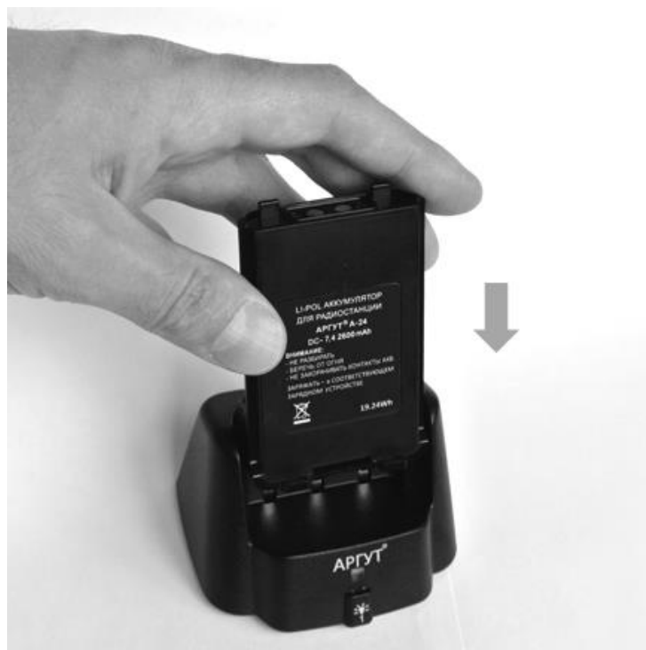
Рис. 7. Установка аккумуляторной батареи на зарядную базу.