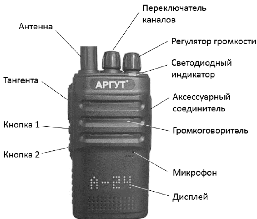
Рис. 1. Расположение органов управления, индикации и соединителей.

Радиостанция выполнена на металлическом шасси, в корпусе из ударопрочного пластика. Органы управления и индикации расположены на верхней и левой панелях корпуса. Соединитель антенны — на верхней панели. Соединитель подключения гарнитуры и кабеля программирования (аксессуарный соединитель) — на правой панели. Клеммы для присоединения к зарядной базе — на задней стенке аккумуляторной батареи.