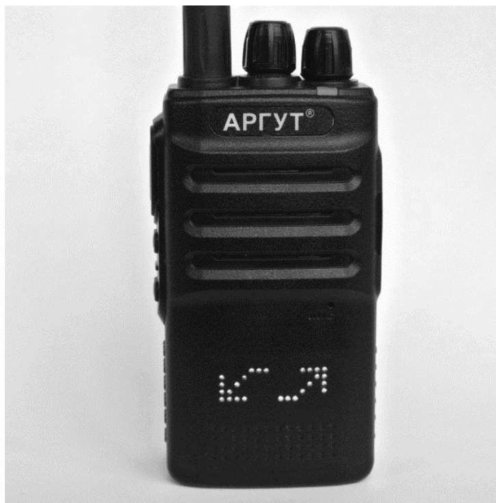
Рис. 10. Индикация сканирования.

Радиостанция поочередно сканирует каналы, в настройках которых разрешено сканирование. При приёме вызова на одном из сканируемых каналов, включится режим приёма — из громкоговорителя будет звучать сообщение абонента. Для выхода из режима сканирования каналов воспользуйтесь меню.