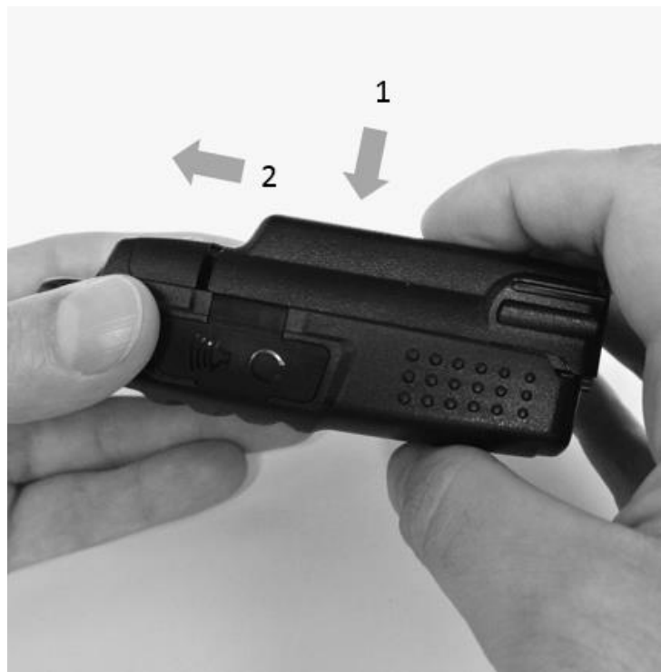
Рис. 2. Установка аккумуляторной батареи.

Совместите направляющие на аккумуляторной батарее с направляющими на шасси приёмопередатчика. Прижмите батарею к шасси и сдвиньте влево до щелчка.